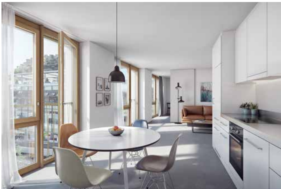
Etagenwohnung mit Blick auf Altstadt