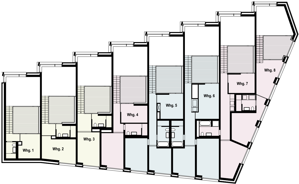
GRUNDRISS 4. OBERGESCHOSS