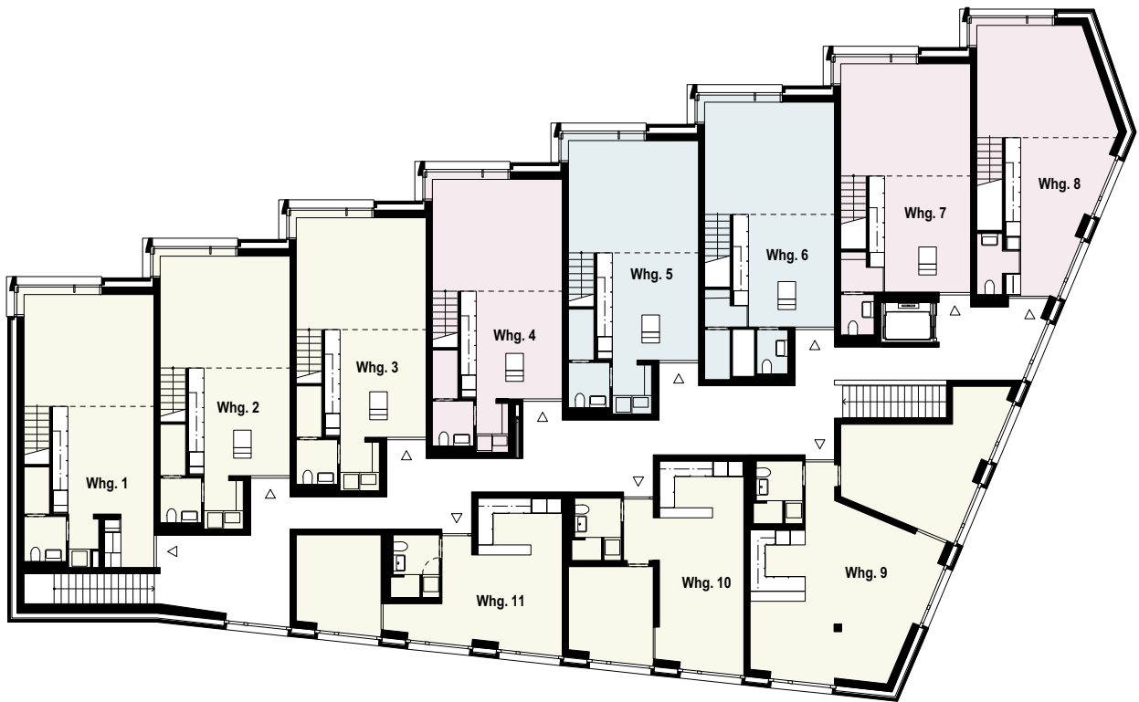
GRUNDRISS 3. OBERGESCHOSS