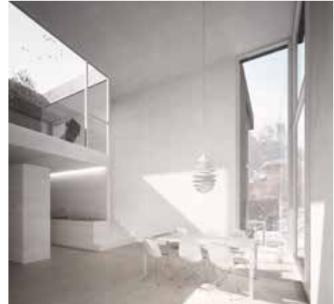
Visualisierung eines Wohnraumes mit Dachloggia