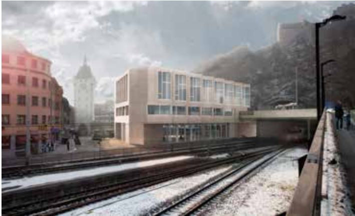
Visualisierung des Geschäfts- und Wohnhauses

Für den Neubau schrieb die Stadt Baden zusammen mit der Miteigentümergeinschaft einen Architekturwettbewerb aus. So wird sichergestellt, dass das Projekt den hohen städtebaulichen Anforderungen und der Komplexität des Neubaus Rechnung trägt und die Qualität sichert. Die Stadt Baden und die private Bauherrschaft haben zusammen mit externen Experten aus 10 Projekten ausgewählt. Das Siegerprojekt ist ein Entwurf von den BDE Architekten aus Winterthur.